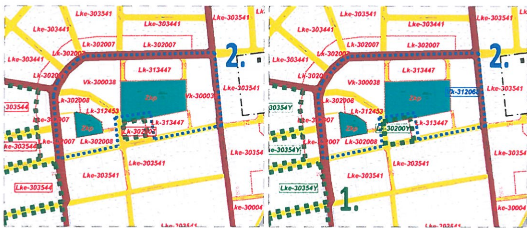
Joghatályos terv részlete